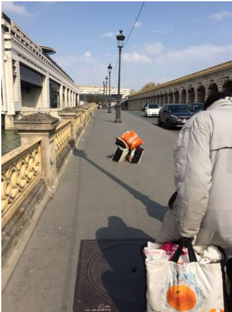
Trajet de la station Quai de la Gare au banc d'Adama en face de la station Bercy. Temps de trajet : 35 minutes.

deux sacs, les pose, revient chercher deux autres sacs, etc.