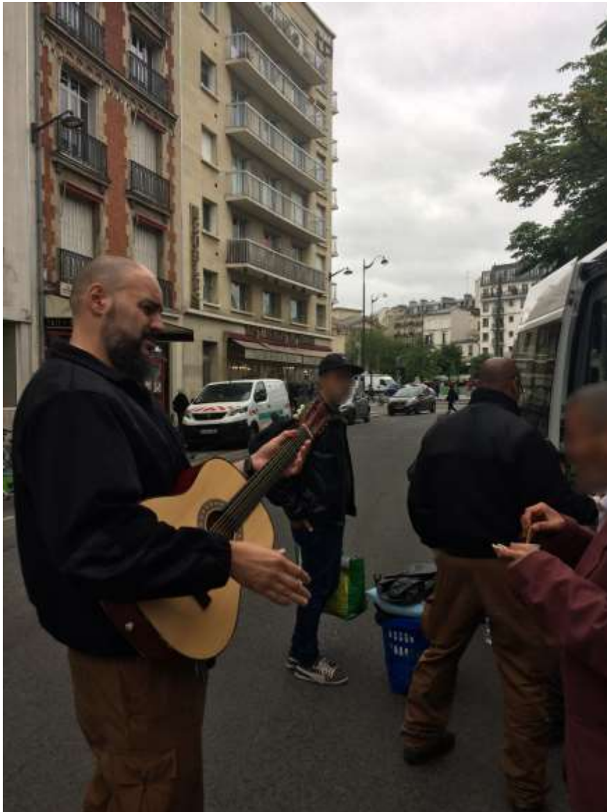
Photo d'un agent jouant de la guitare devant le minibus place de la Nation

Ainsi observe-t-on au cours des missions agents et sans-abris visionnant ensemble un clip de salsa sur un téléphone, commentant les résultats du match de foot qui vient de s'achever, voire chantant et dansant.